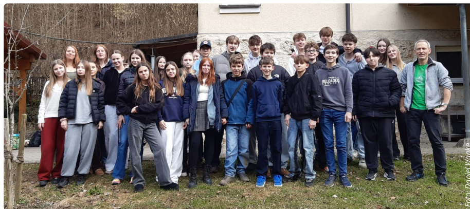
Konfi-Freizeit im März in der Sachsenmühle