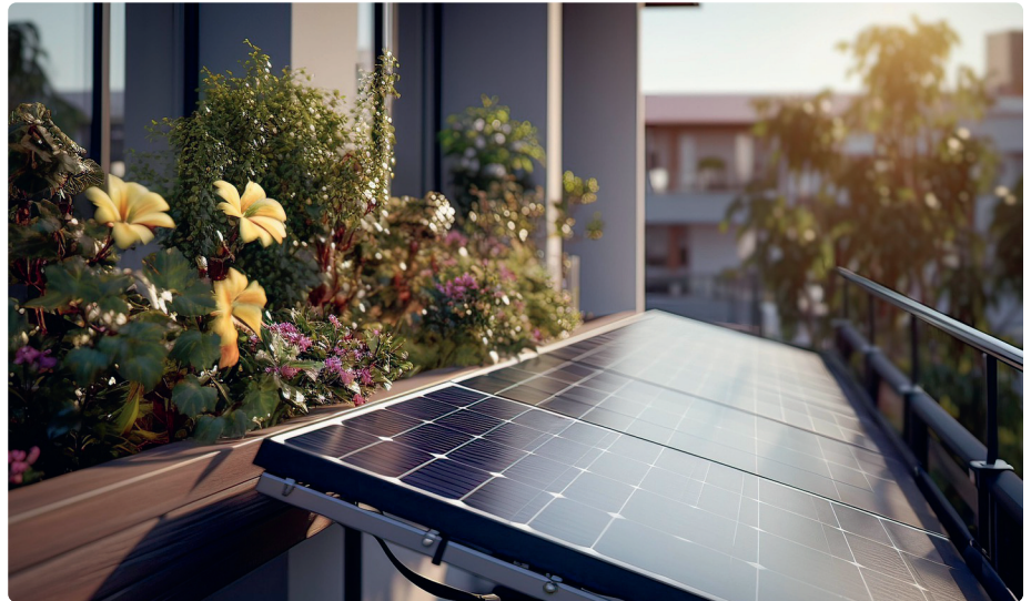
Kostengünstig eigenen Öko-Strom erzeugen

Der Boomer-Club lädt zu diesem Thema am Donnerstag, 5.2., um 19 Uhr speziell Besitzer von Häusern und Eigentumswohnungen sowie Mieter von Wohnungen mit Balkon ein. Es geht u.a. um Kosten, rechtliche Fragen und Praktisches wie technische Voraussetzungen oder den Einsatz eines Speicherakkus.