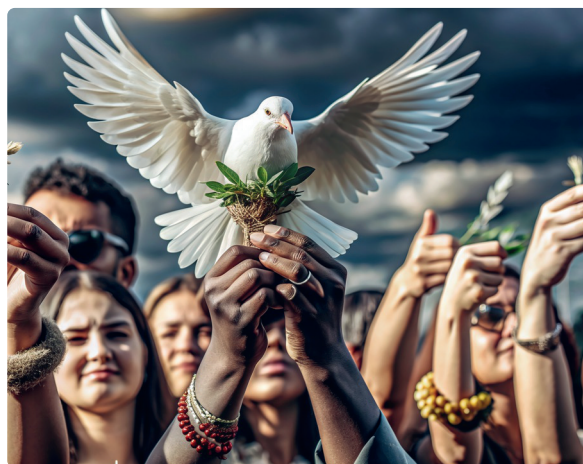
Frieden stiften durch bewusste Kommunikation

Die Termine: 4.2. / 11.2. / 25.2. / 4.3.