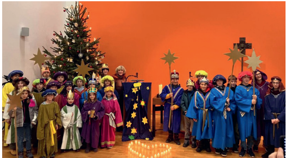
Die Sternsinger bei der "Einholung" in der Lukas-Kirche am Dreikönigstag Anfang 2025