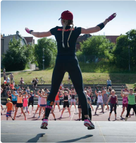
Fit bleiben mit Zumba