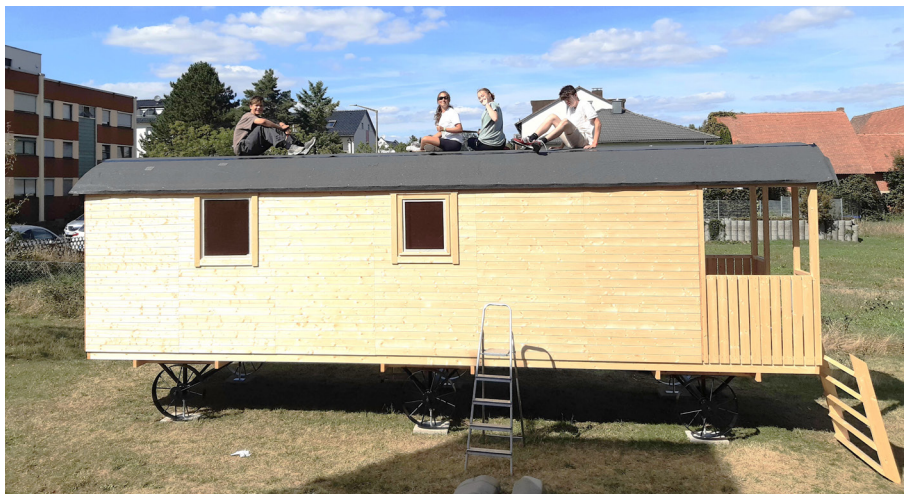
Der „Pudding-Trailer“ kriegt das Dach drauf